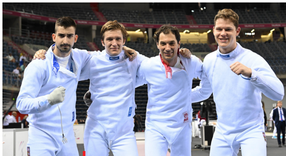
Bronzoví kordisté z OH 2024

Sportovní psycholog tak může sportovcům pomáhat s překonáním nějaké aktuální zátěže, která zasahuje i do sportovního výkonu (např. překonání nepříjemného zranění, zkuškové období, přechod do nového týmu), stejně tak může být nápomocen při dosahování krátkodobých/aktuálních cílů, např. v podobě zvládnutí nomináčních závodů aj. Se sportovci lze ale pracovat také dlouhodobě, obvykle se záměrem ražení systematické psychologické přípravy k optimalizaci výkonu a naplnění potenciálu, nebo prevenci předčasného ukončení sportovní kariéry. Možností je také práce s celým sportovním týmem, což s sebou nese větší nároky na čas psychologa a spolupráci s trenérem/y.