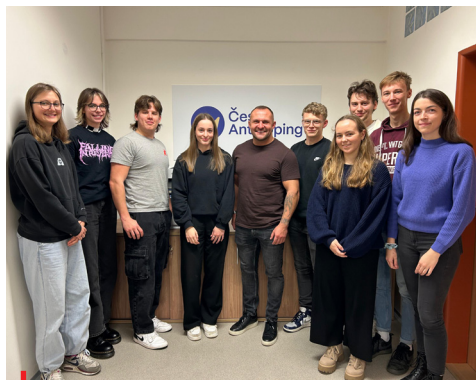
Studenti Managementu sportu FTVS Univerzity Karlovy na praxi v Českém Antidopingu.

Účast na akcích, jako je Olympiáda dětí a mládeže, nám umožňuje mluvit o fair play přímo tam, kde se rodí budoucí šampioni. Vzdělávání nejde dělat od stolu - chceme naslouchat, diskutovat a inspirovat se. Proto jsme vyrazili se vzdělávacím stánkem na Olympiádu dětí a mládeže - tentokrát do Haly Polárka ve Frýdku-Místku, kde jsme předávali antidopingové znalosti účastníkům i návštěvníkům ODM.